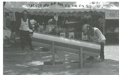
丸太合わせ切り競技