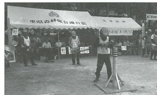
輪切りリレー競争